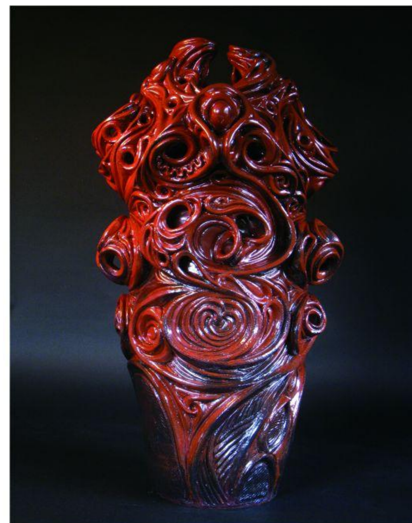
精霊のほころび（2014年） 縄文法曾陶・陶オブジェ