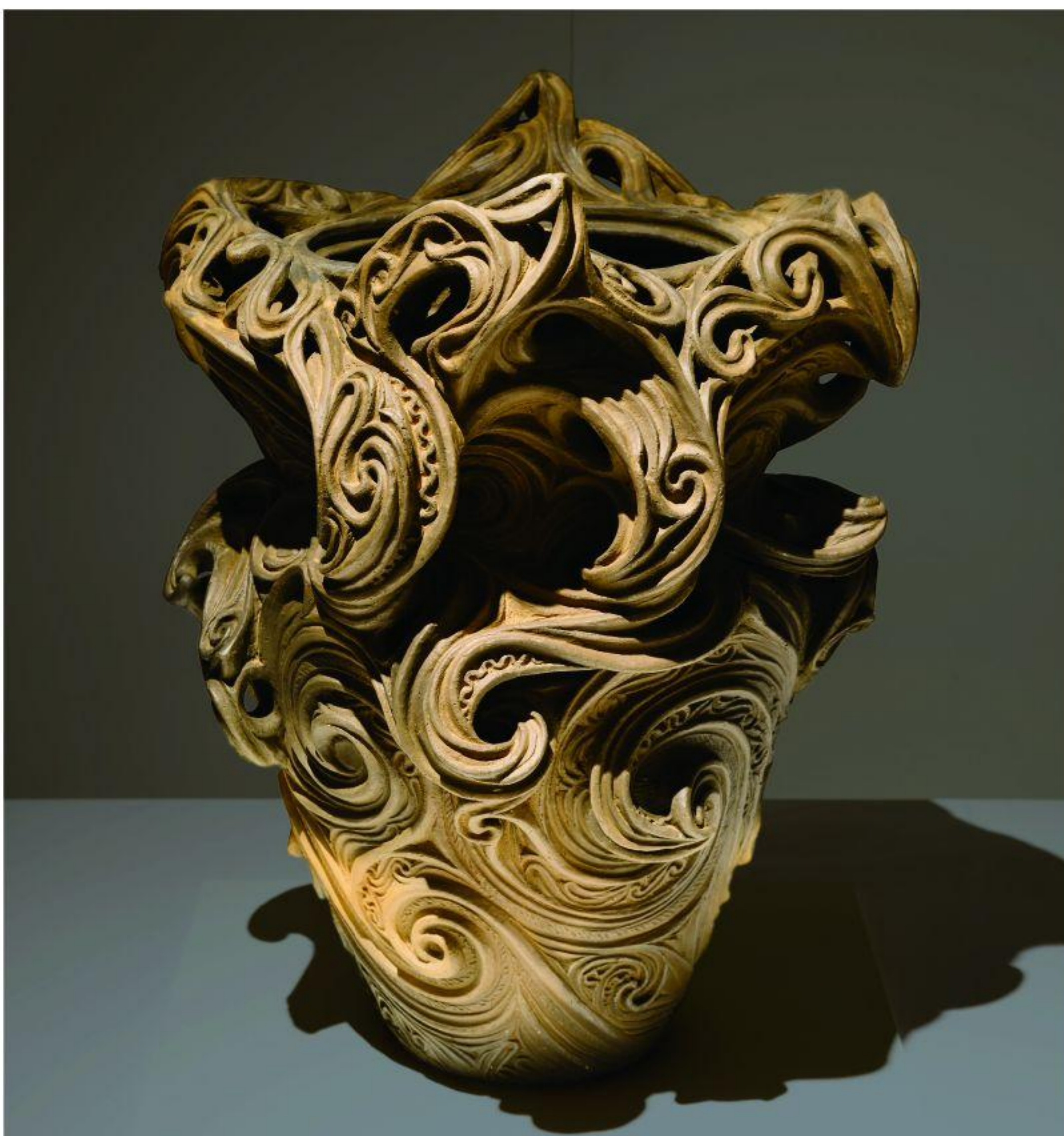
生命の大地（2017年） 縄文野焼き作品

「大地は生命の淵源であり、縄文思考の基盤である。生命が大地から湧きあがり、そのふとこで獣や草木や精霊や人として生まれ、死んでふたたび還ってゆく。大地に根ざす思考が 縄文の住居や墓や縄文土器には表されている。大地の肉である粘土、地から天へ立ちのぼるような文様、地べたの火が器に命を宿す野焼き。土器は煮炊きの道具であるに留まらず、造形によって時空を越えて祈りと宇宙観を伝える魂の器でもある。」（村上原野）