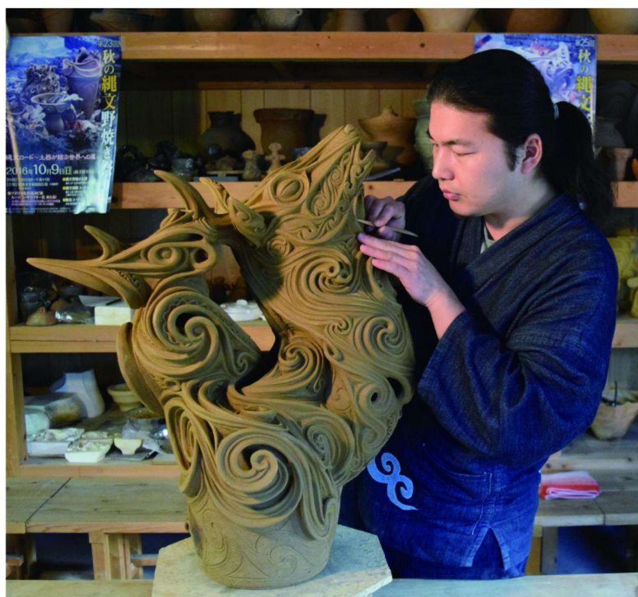
地より来て地に還るもの（2019年） 制作中の村上原野