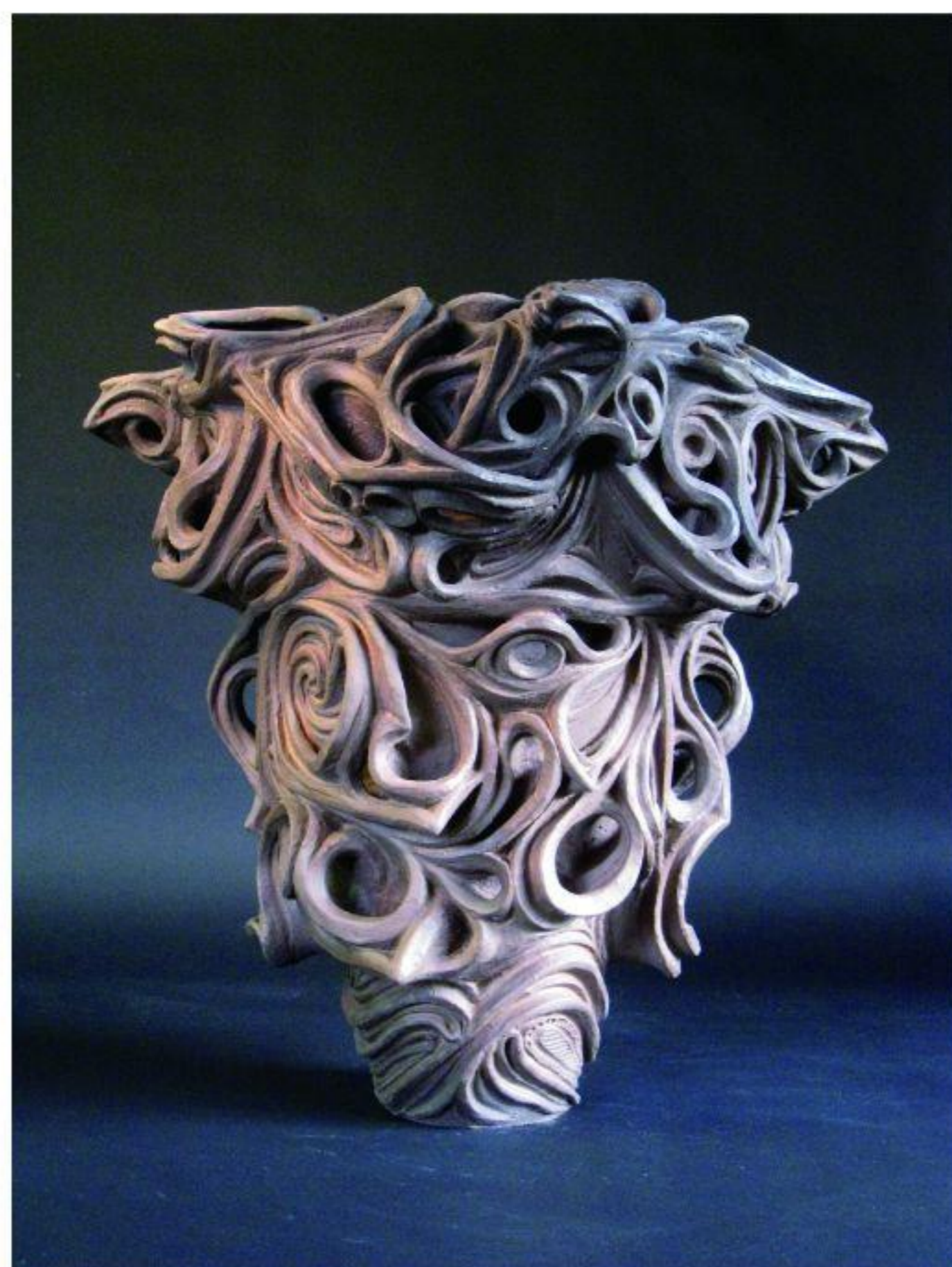
Sensorium(2014年) 縄文野焼き作品