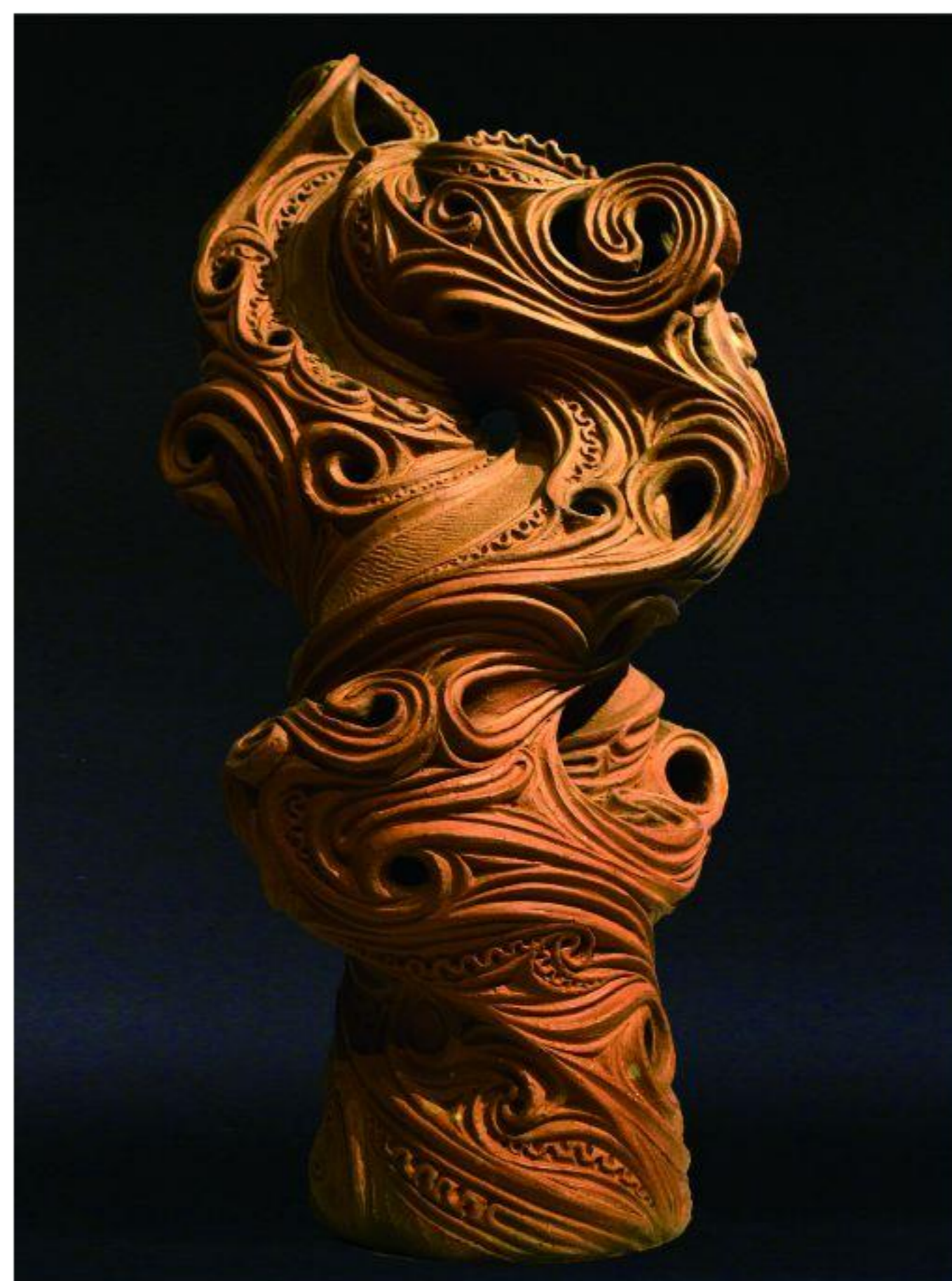
生命双螺旋2（2016年） 縄文野焼き作品